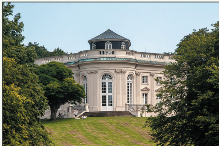
Schloss Richmond - auf einer leichten Anhöhe am Okerstrand errichtet.

Längst ist das Schloss Richmond im Besitz der Stadt Braunschweig – schade, dass dieses geschichtsträchtige Gebäude lärmmäßig durch die stark befahrene Wolfenbütteler Straße sowie die nahe Straßenbahnlinie so beeinträchtigt wird.