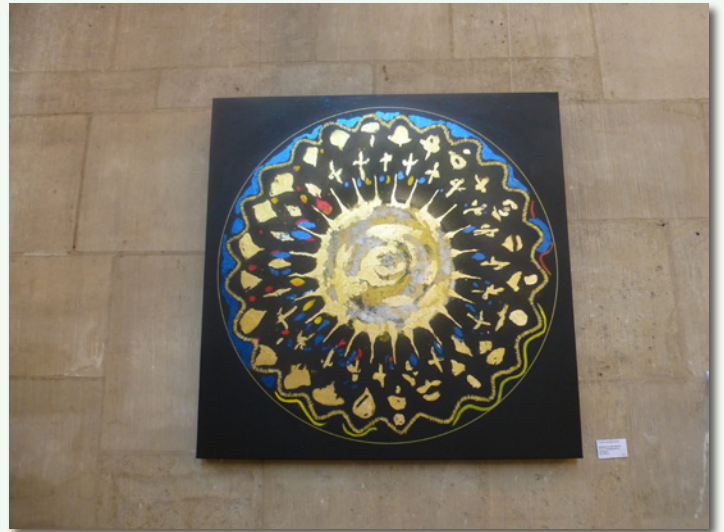
Antwort an das Wasser Von Felicitas Nicolai-Kujawa