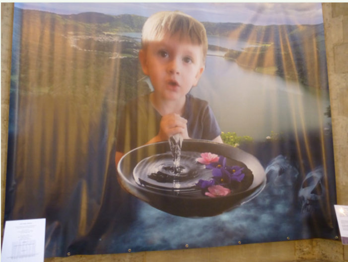
Eine Collage „Hoffnung“ Von Daria Beyer