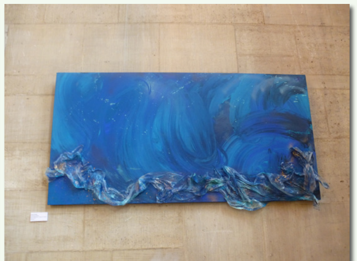
Verborgene Realität Von Katrin Schmidt