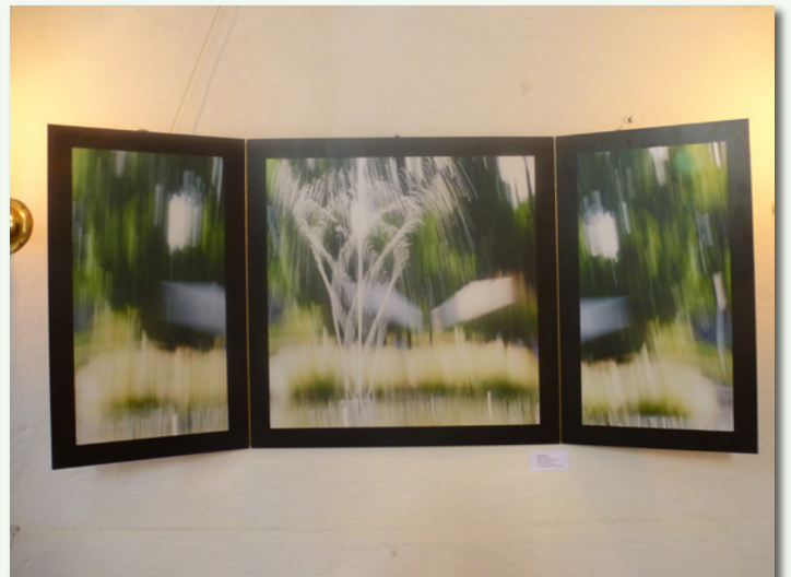
Fresh von Bärbel Mäkeler