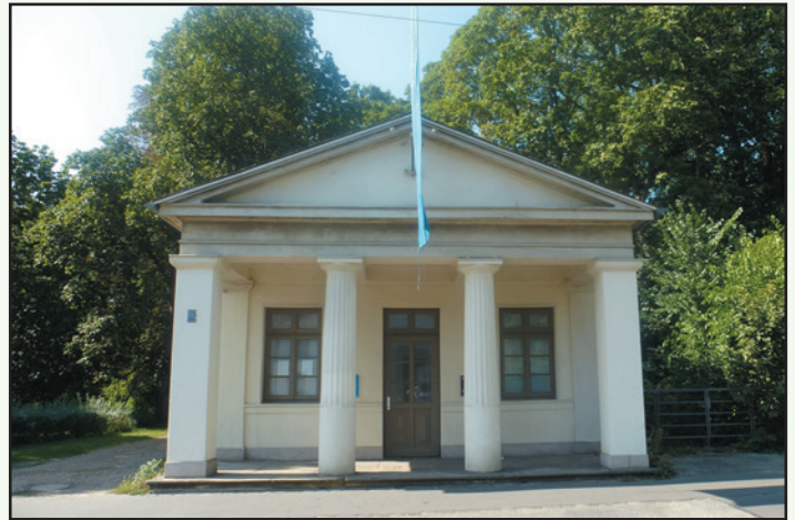
Eines von vielen Torhäusern - sie sehen alle gleich aus.

Die Torhäuser am Wendentor sind besonders auffallend. Die spiegelbildlich aufeinander bezogenen und baugleich gestalteten ehemaligen Wach- und Zollhäuschen markieren den Okerübergang im Verlauf der Fernstraße nach Hamburg. Die eingeschossigen Putzbauten bilden mit den stadtseits vorgelegten Rasenflächen eine Einheit. Sie wurden von Peter Joseph Krahe entlang der Okerumflut auf dem Gelände der aufgelassenen Befestigung angelegt. Das Wendenwehr reguliert seit der Anlage des Promenadenringes den Wasserstand der östlichen Okerumflut. Im Westen schließt das zum Aussichtsbauwerk umgestaltete Rudolfsbauwerk an den Gaußberg an.