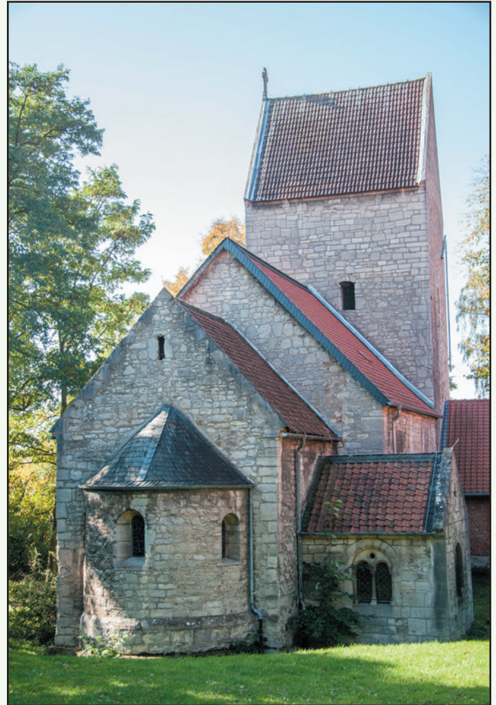
In Kneitlingen mags gewesen sein

Mit freundlicher Genehmigung entnommen aus: „Ik vertell di wat“, Plattdeutsche Geschichten aus unserem Land, zusammengestellt von Jürgen Hodemacher, Cremlingen 1997, Seite 112.