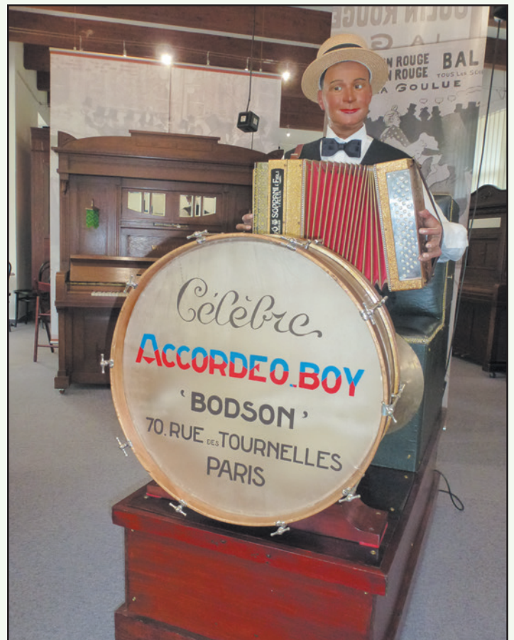
Musikautomat Tino Rossi

Die Wartung der Instrumente kann deutschlandweit nur noch von einem Fachmann durchgeführt werden. Ersatzteile gibt es für die Automaten kaum noch oder gar nicht mehr. Daher steht zu befürchten, dass die Instrumente eines nach dem anderen nicht mehr vorgeführt werden können. Dies wird unweigerlich eines Tages zur Schließung dieses interessanten Museums führen. Bis dahin sei gesagt: Ein Museumsbesuch lohnt sich!