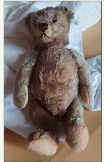
Teddy 65 Jahre alt

Das Unternehmen Steiff ist bis heute in Familienbesitz geblieben. Margarete Steiffs Geburtshaus in Giengen, Baden-Württemberg, ist bis heute zu besichtigen. Im Jahr 2005 wurde das Erlebnismuseum Steiff eröffnet. Höchste Preise werden heute von Bärenliebhabern, den Arktophilen, für Steiff-Teddys auf Auktionen gezahlt.