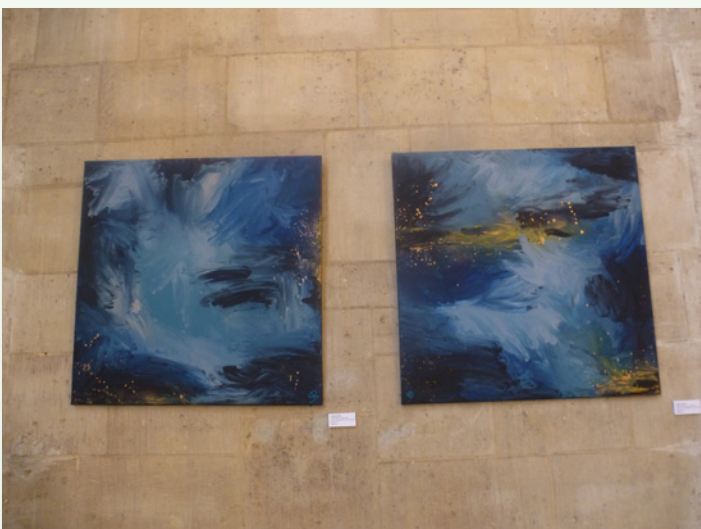
Gestrandete Erinnerung Von Katrin Schmidt