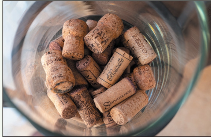
Jede Sammlung fängt klein an

Ökosystemen weltweit. Die älteste und produktivste Korkeiche wurde nachweislich im Jahr 1783 gepflanzt. Sie ist über 14 Meter hoch,