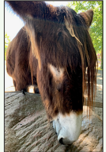
„Müllers Esel“ ist mir egal. Ich bin einer von mehreren Eseln im Tierpark Essehof.