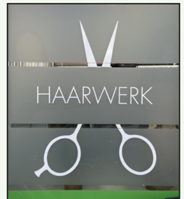
Hier entstehen schöne Frisuren.

Dafür beschloss ich, die Aufforderung des Buchs der Bücher künftig besonders ernst zu nehmen und gute Werke aus vollem Herzen zu tun, um sie auf diese Weise zu meinen persönlichen Herzenswerken zu machen.