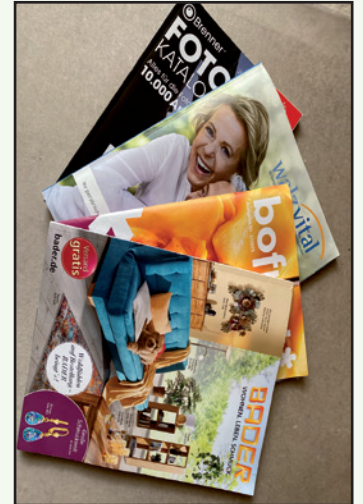
Mehrmals und in großer Zahl.

mit mehrsprachigen handkolorierten Katalogen für Damenmode wurde 1887 in Graz von dem Modekaufhaus Kastner & Öhler gegründet für die gesamte österreichisch-ungarische Monarchie. Die bestellten Waren wurden per Postkutsche an die Kunden ausgeliefert.