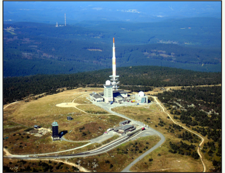
Luftbild der Brockenkuppe 2009.

den Mund. Ich durfte ihm mehrfach begegnen. Als ich weit weg lebte, war der Brocken auch für mich ein Sehnsuchtsberg.