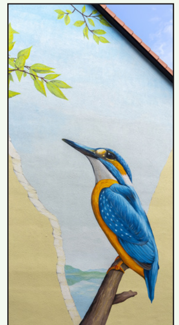
Titelfoto: Der Eisvogel bedeckt die gesamte Hauswand Am Queckenberg