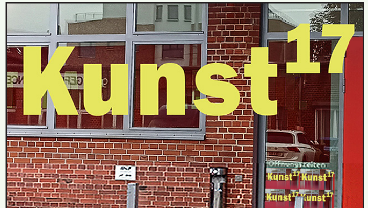
Logo der Halle 267.

geben, und zwar am 18. und am 21. November jeweils um 18 Uhr. Die Halle 267 ist mit den Straßenbahnlinien 1 und 2 gut erreichbar.