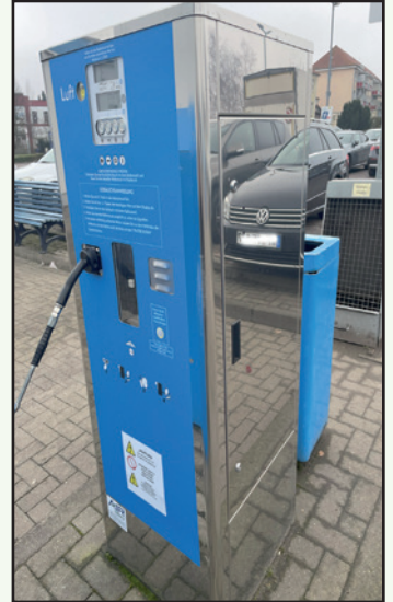
Ein modernes Gerät zur Prüfung des Reifendrucks.

Ich kann mich nicht erinnern, dass bei einem meiner vorherigen Autos die Reifendrucke bzw. das Auffüllen ein Problem gewesen wäre!