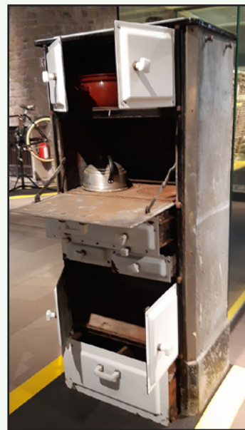
Herd der Firma Gerecke aus Braunschweig, o.J., im Städtischen Museum Braunschweig / Altstadt-rathaus.

herde hatten teils eine zusätzliche Vertiefung, welche man mit Koks oder heißer Asche befüllte. Die Abdeckplatte bestand aus mehreren ineinander gesetzten Ringen, die einzeln von innen nach außen herausgenommen werden konnten, um die Öffnung dem Kochgeschirr anzupassen. Diese Funktionsweise übernahm der Leipziger Schlosser Hermann Tänzer, als er im Jahre 1882 einen Grudeherd konstruierte. Seine anfänglich kleine Fabrik vergrößerte sich schnell. Im Jahr 1906 konnte bereits der Verkauf von ca. 7.000 Öfen gemeldet werden, und das Unternehmen firmierte als „Tänzers Original-Grudeofen-Fabrik GmbH“. 1908 wurde die Fabrik nach Hannover verlegt, die Technik in der Folge verbessert. Die Frontseite und die Seitenflächen des Grudeherds waren nun weiß emailliert. Er war untergliedert in Schubladen und mehrere Etagen mit Fächern, die mit Flügeltüren geschlossen werden konnten. In der unteren Lade konnte Kochgeschirr aufbewahrt