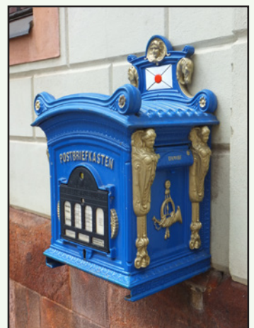
Dieses Prachtexemplar einer Nachbildung des preußischen Briefkastens von 1896 entdeckte die Verfasserin in Torgau/Elbe.