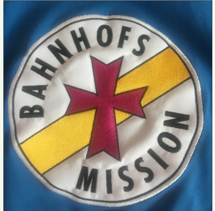
Auf den Jacken der Mitarbeiterinnen und Mitarbeiter sowie auf den Hinweisschildern der Bahnhöfe weist dieses Etikett auf die ökumenische Idee der Einrichtung hin. Das Kreuz steht für die evangelische, der gelbe Streifen für die katholische Kirche.

Asylsuchende oder Ukraine-Flüchtlinge kümmerten. Zusammenfassend: Die Bahnhofsmissionen halfen