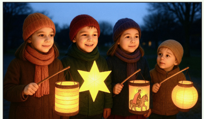
Ümtog mit Latüchten - verfertigt mit Kl.

de Gören: „Wat Sööts or dat giffit wat Suers!“ Un wenn ik denn villicht bi een vun de Navers höör: „Witten Tweern, swatten Twern, de ole Hex hier giffit nich ge- ern!“, denn heff ik doch 'n beten Freud: Schadenfreud.