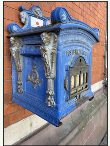
Nachbildung eines Briefkastens von 1896 in Celle.

Die Farbenlehre der Briefkästen ist lustig, beispielsweise gab es lichtblau für Luftpost und mausgrau für Briefkästen auf dem Lande. Da ist mir einheitlich ginstergelb doch lieber! Aber ausprobieren werde ich das blaue Exemplar dennoch, es ist einfach zu schön.