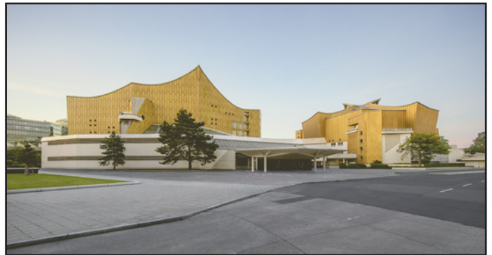
1963 wurde die Berliner Philharmonie eröffnet.

Der Wolfsburger Theaterbau wurde zwischen 1965 und 1973 realisiert und verfügt über eine optimale Opern- und Konzertakustik. Zur Bau-Idee gehörte es, das Gebäude auf halber Höhe eines Hügels zu errichten. Wie auch in Berlin integrierte Hans Scharoun hier Schallsegel im Innenraum. Wer sich für den Wolfsburger Theaterbau näher interessiert: Martin Weller will im Wintersemester 2025/2026 eine Führung anbieten.