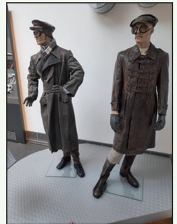
... und dazu die passende Bekleidung.