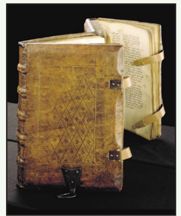
Lederschließen aus Sachsenspiegel (Stadtbibliothek Duisburg).

nige Seiten zu lesen. Wer ein Buch liest, hat eine höhere Lebenserwartung. Laut der Studie fördert es zudem die geistige Beweglichkeit, die soziale Wahrnehmung und die emotionale Intelligenz. Das Aufschlagen und Lesen des Braunschweiger Journals ist dazu schon ein erster kleiner Schritt.